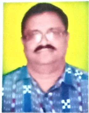
Sri Parameswar Day